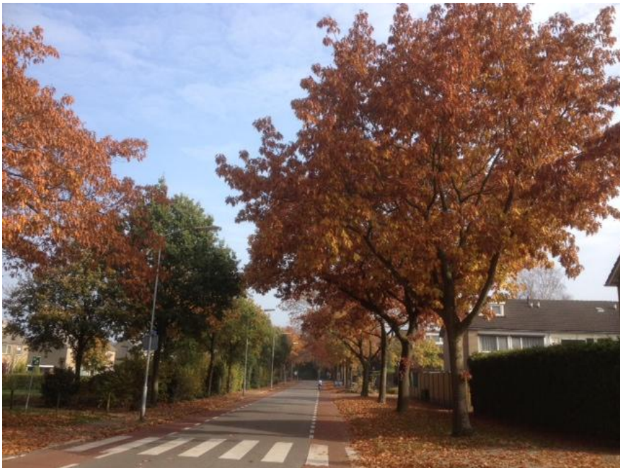
Foto: Beeldbepalende bomenstructuur Molensingel

De gebiedsontsluitingswegen zijn bijvoorbeeld zoveel mogelijk begeleid door een tweezijdige laanbeplanting. Het betreft inmiddels grote bomen, zoals de eiken langs de Randwijksingel en Molensingel. Op veel plekken langs de Veldsingel en Groesbeekseweg is er nog geen uniform geheel en moeten er nog bomen vervangen en aangeplant worden. In Heumen vormt de ontsluitingsweg een groen lint vanaf de Dorpsstraat, Boomgaard tot Kapitein Postmalaan. Er staan grote bomen, die waardevol zijn voor het karakter van het dorp. Het beheer is erop gericht de bomenlaan in stand te houden.