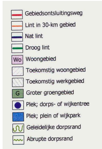
Afb 2: groenstructuur Heumen, afkomstig uit GSP 2007