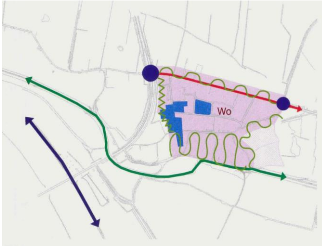
Afb 4: groenstructuur Nederasselt

De gebiedsontsluitingswegen zijn bijvoorbeeld zoveel mogelijk begeleid door een tweezijdige laanbeplanting. Het betreft inmiddels grote bomen, zoals de eiken langs de Randwijksingel en Molensingel. Op veel plekken langs de Veldsingel en Groesbeekseweg is er nog geen uniform geheel en moeten er nog bomen vervangen en aangeplant worden. In Heumen vormt de ontsluitingsweg een groen lint vanaf de Dorpsstraat, Boomgaard tot Kapitein Postmalaan. Er staan grote bomen, die waardevol zijn voor het karakter van het dorp. Het beheer is erop gericht de bomenlaan in stand te houden.