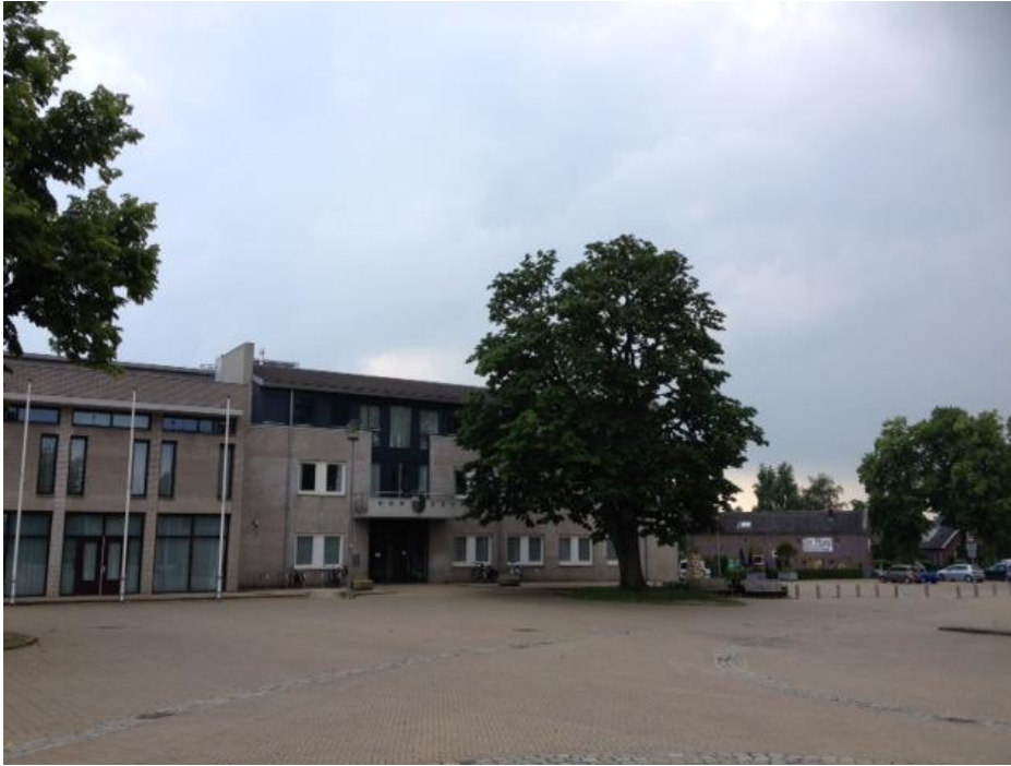
Foto: Kastanje op het Kerkplein

Gestreefd wordt om de bomenstructuur compleet te maken en te beschermen. Daarbij is de beheersbaarheid van de bomen belangrijk, om problemen in de toekomst te voorkomen. Huidige problemen zijn wortelopdruk, door onvoldoende ondergrondse ruimte en noodzaak tot snoeien door onvoldoende bovengrondse ruimte. Het kost dan veel geld om de situatie in stand te houden. Op plekken waar de boom niet beeldbepalend is, wordt dan gekozen de boom te verwijderen.