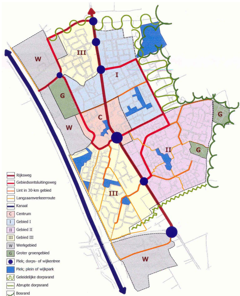
Afb 1: groenstructuur Malden, afkomstig uit GSP 2007

Het groenstructuurplan (GSP) is in 2007 vastgesteld en is een beleids- en toetsingskader voor de ontwikkelingen van de groenstructuur en het groenareaal binnen de vier bebouwde kommen van de gemeente Heumen. De bomen vormen als lijn of vlak de groenstructuur en zijn als structuur waardevol.